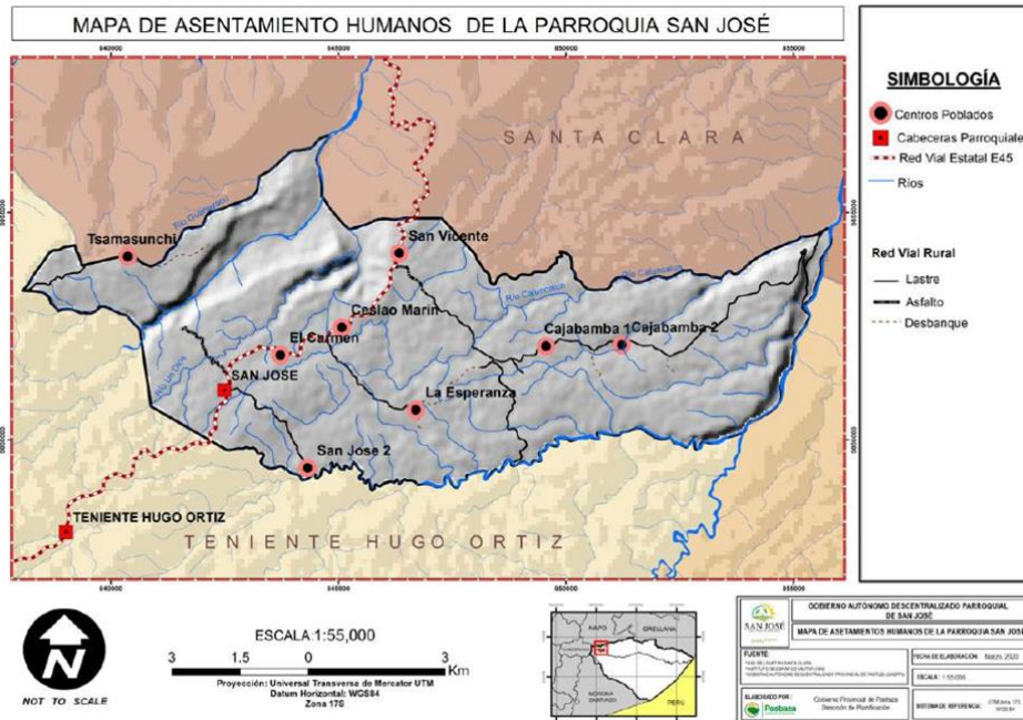
Figura 1. Parroquia rural San José. Nota. El gráfico representa el mapa de asentamiento humano de la parroquia San José. Tomado del GAD parroquial rural San José, 2015. La sigla GAD significa Gobierno Autónomo Descentralizado.

La investigación se realizó en la parroquia rural San José, cantón Santa clara, provincia de Pastaza, ver “Figura 1”.