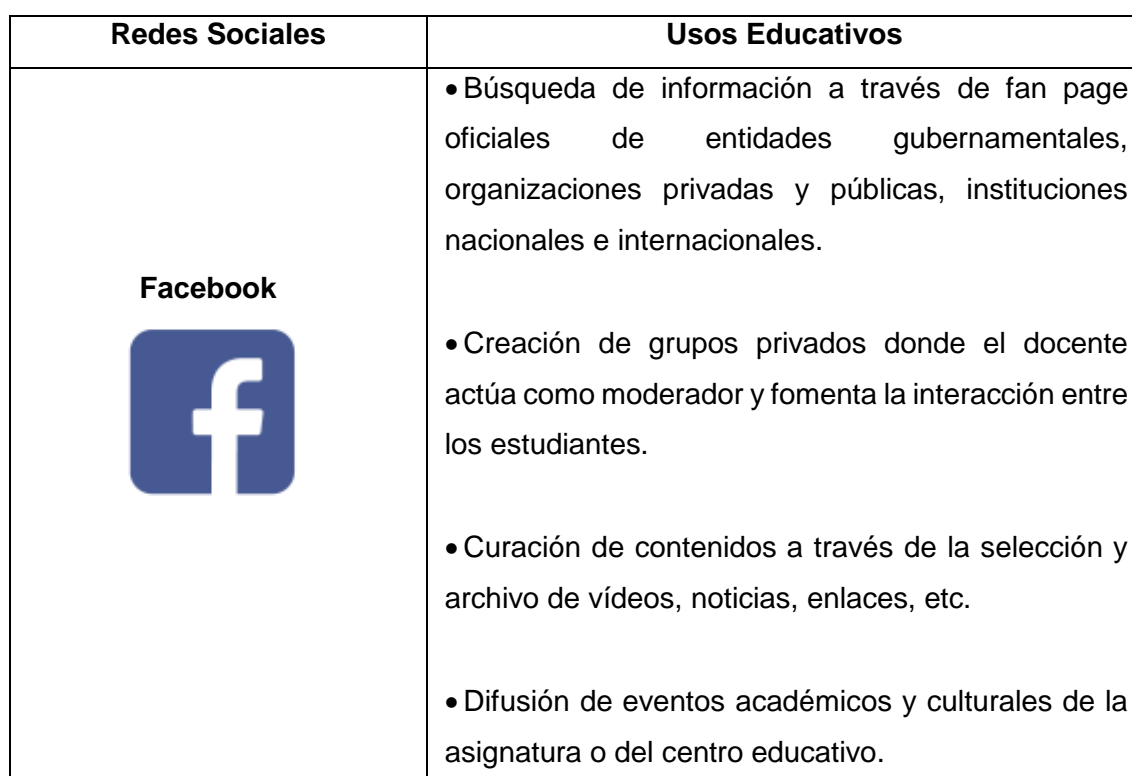
Tabla 1. Principales usos educativos de las principales redes sociales.

A continuación, luego del análisis realizado de las fuentes bibliográficas seleccionadas, se presentan los principales usos educativos de las redes sociales Facebook, Twitter, Instagram y Pinterest.